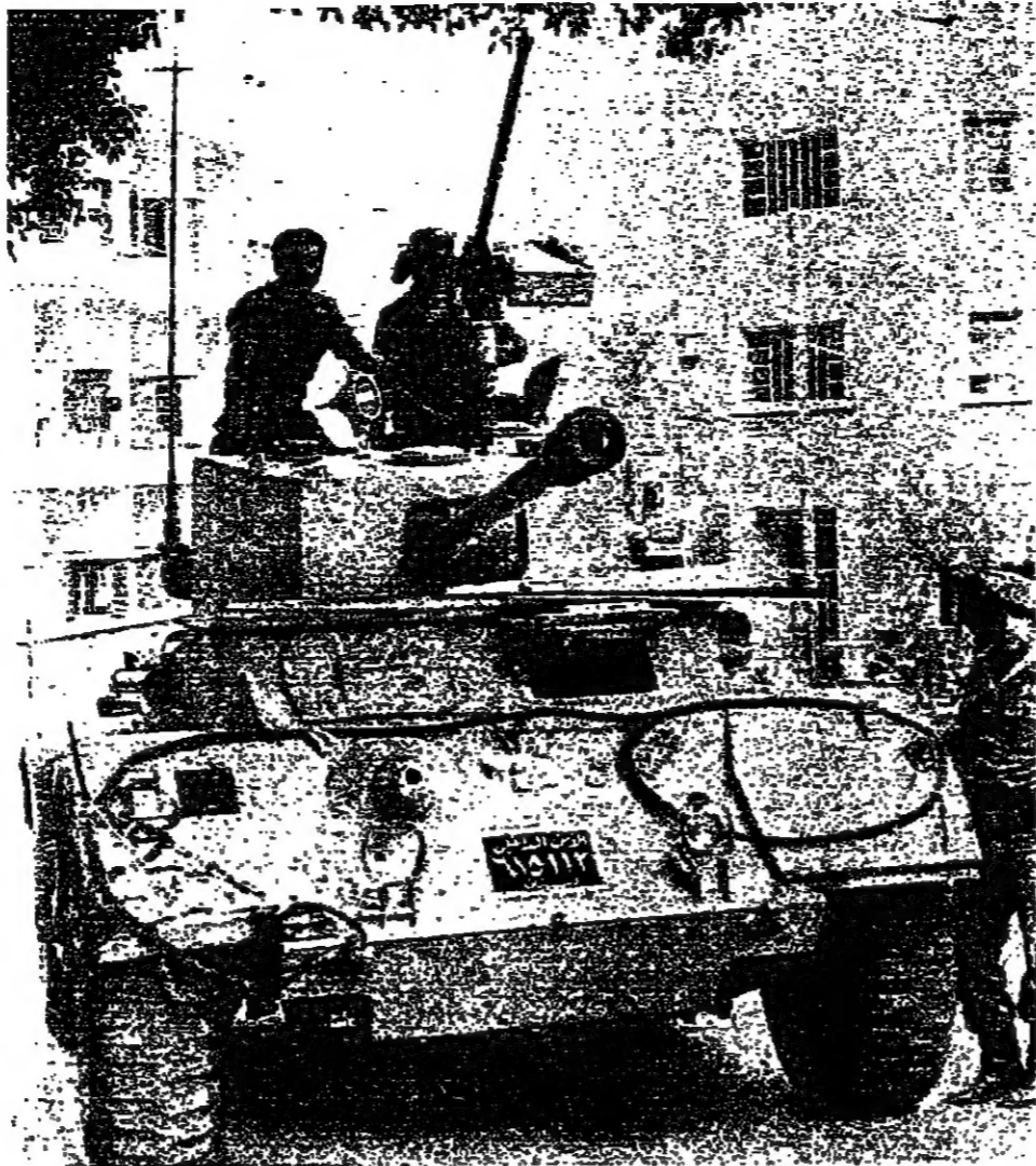
مخففة لقوى الأمن في شارع سيريس